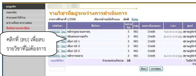
แสดงหน้าเว็บเพจรายวิชาที่อยู่ระหว่างการดำเนินการ

2) เมื่อนักศึกษากดปุ่ม “ดึงรายวิชาตามแผน” ระบบจะดึงรายวิชาที่ทางสาขาของนักศึกษากำหนดเป็นแผนรายวิชาได้มาแสดง พร้อมทั้งแสดงข้อมูลที่สำคัญต่าง ๆ ได้แก่ รหัสวิชา ชื่อวิชา จำนวนหน่วยกิต กลุ่มการเรียน (sec) วัน/เวลาเรียน จำนวนหน่วยกิตรวม และค่าใช้จ่ายรวม ดังภาพต่อไปนี้